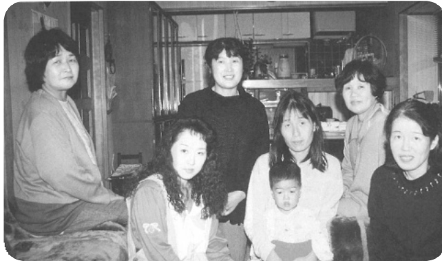
マリゴールド班（健康のひろば1994年10月号より）

「ゆるりの会」では2ヶ月に1回医療生協2階の会議室に集まって、軽い運動で身体をほぐし、介護者同士のおしゃべりで心もゆるめ、リフレッシュしています。ケアマネさんやヘルパーさんからプロのお話を聞くこともあります。