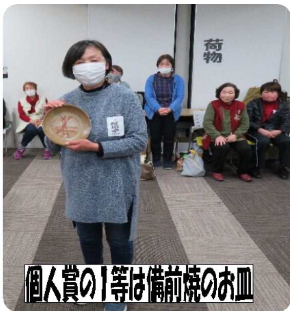
個人賞の1等は備前焼のお皿