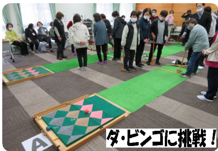
ダ・ビンゴに挑戦!

3月19日、班・支部合同交流集会を開催し、津山発祥のニュースポーツ、ダ・ビンゴ(※1)を行い、3支部やその他地域から多くの申し込みがあり、48人の参加と盛況な企画となりました。