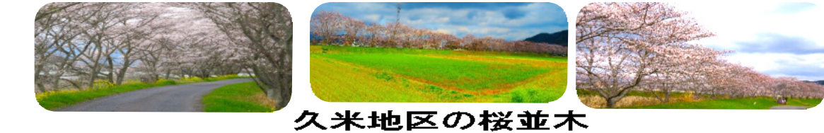
久米地区の桜並木