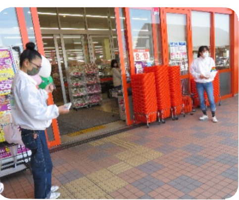
1時間程度ですべて配り終えました。

※1【ダ・ビンゴの仕組み】 ボーリングレーンのように縦長の人工芝の先にグラウンドゴルフの要領でボールを打ちます。ボーリングのピンのような位置に「3×3」の計9マス(くぼみ)があり、