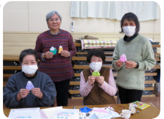
スバル班（2024年3月班会）

2023年度はスバル班を含め6つの新しい班が誕生し、それぞれが定期的に班会を開催しています。