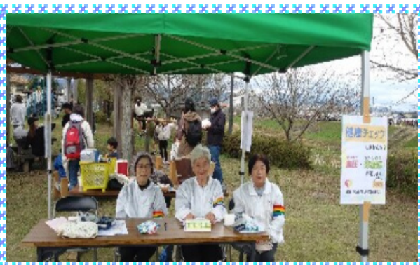
健康サポーターの皆さん ご協力ありがとうございました